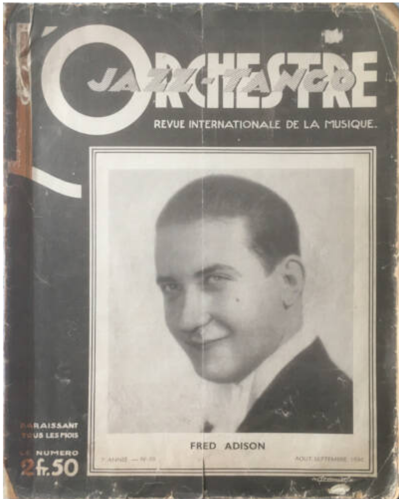
Orchestre-Jazz Tango (L) Cote CEMJazz: med-rv-cat-67