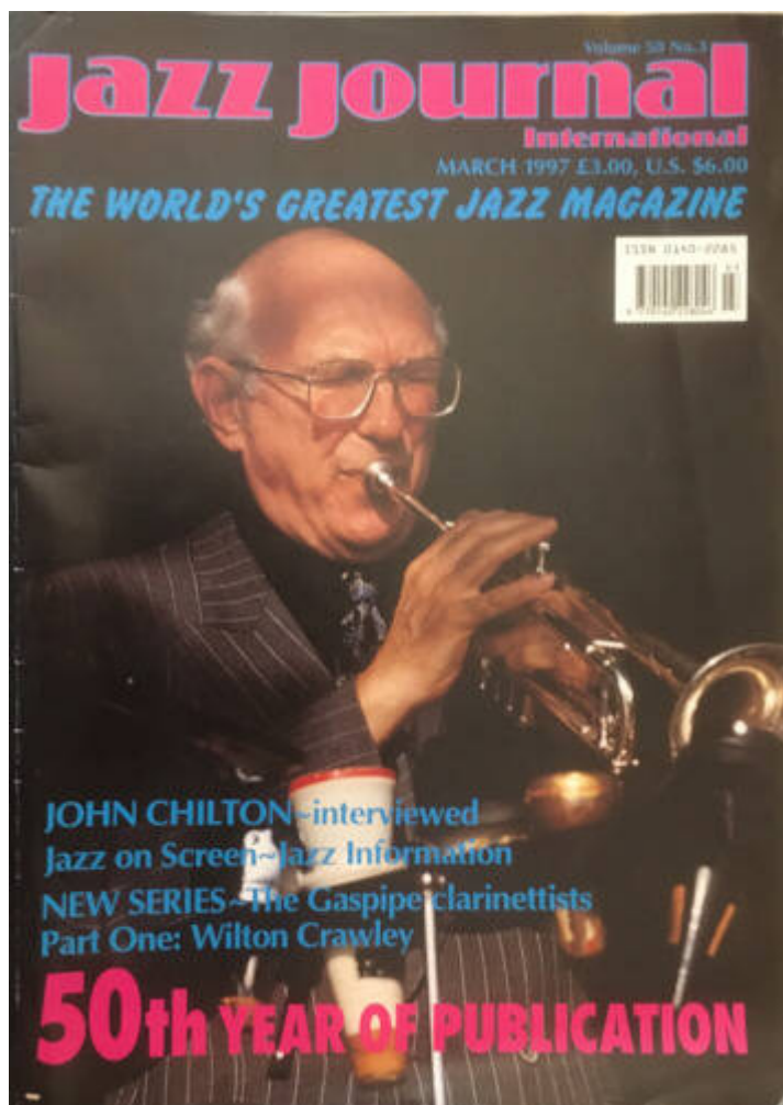
Jazz journal [alt. 2]