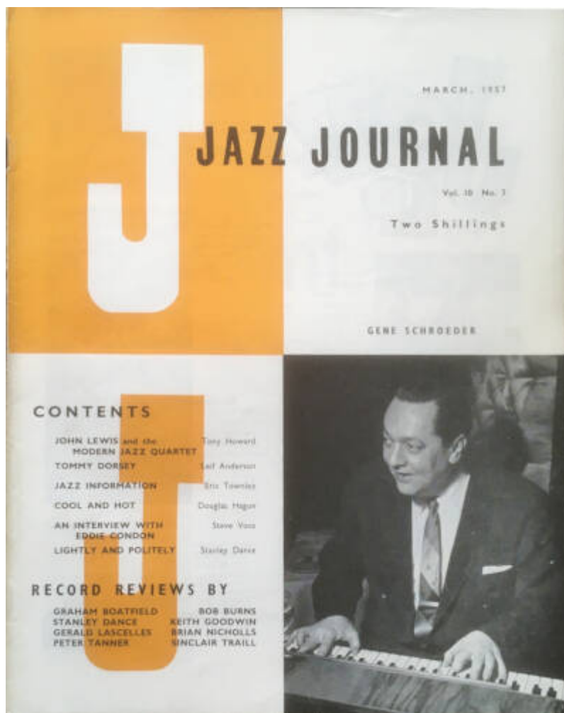
Jazz journal [alt. 3]