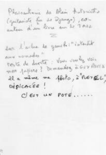
Cote CEMJazz: pve-docp-phot-5-19 (verso)