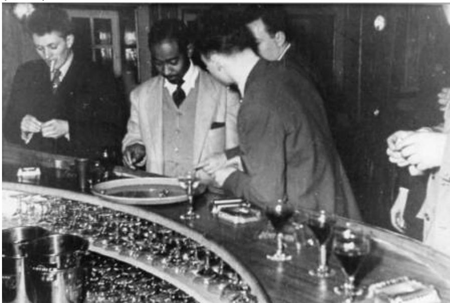
Cote CEMJazz: pve-docp-phot-5-6 (recto)