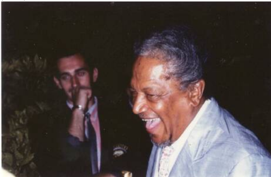
Cote CEMJazz: pve-docp-phot-5-15 (recto)