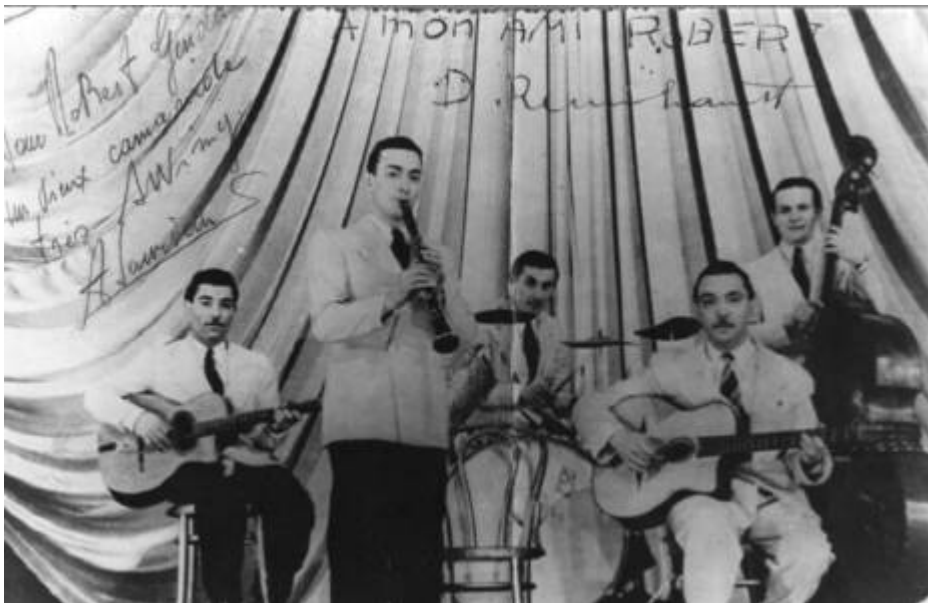
Cote CEMJazz: pve-docp-phot-5-12