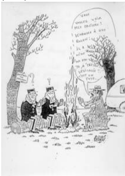
Cote CEMJazz: pve-docp-phot-5-19 (recto)