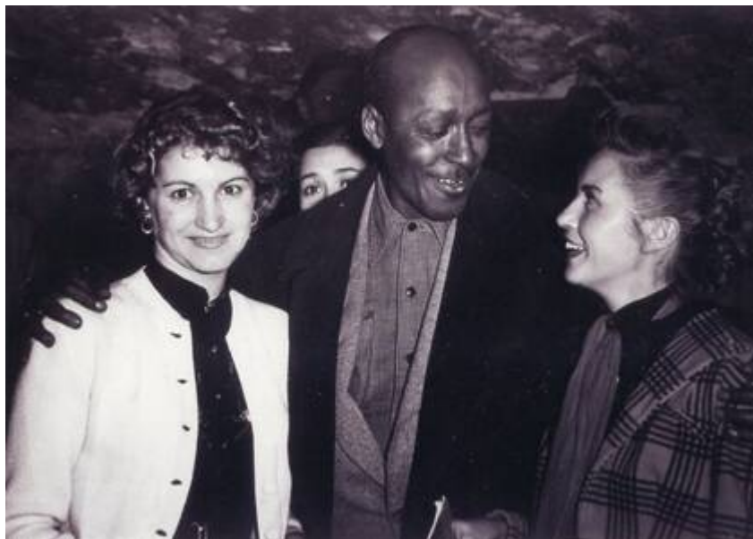
Cote CEMJazz: pve-docp-phot-5-1 (recto)