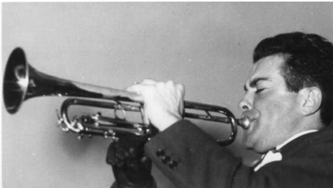
Cote CEMJazz: pve-docp-phot-5-7 (recto)