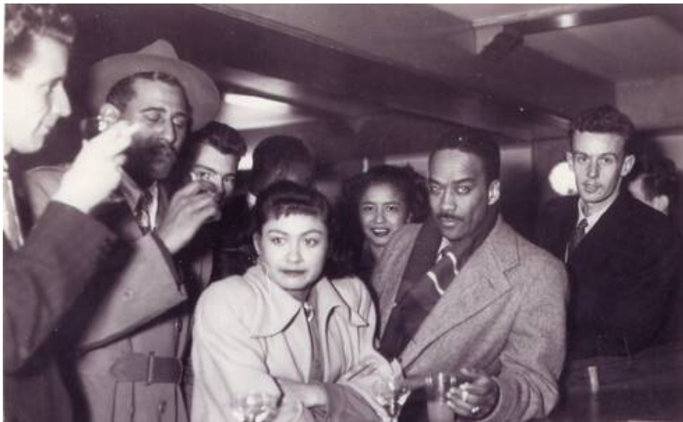
Cote CEMJazz: pve-docp-phot-5-3