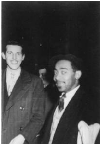
Cote CEMJazz: pve-docp-phot-5-8