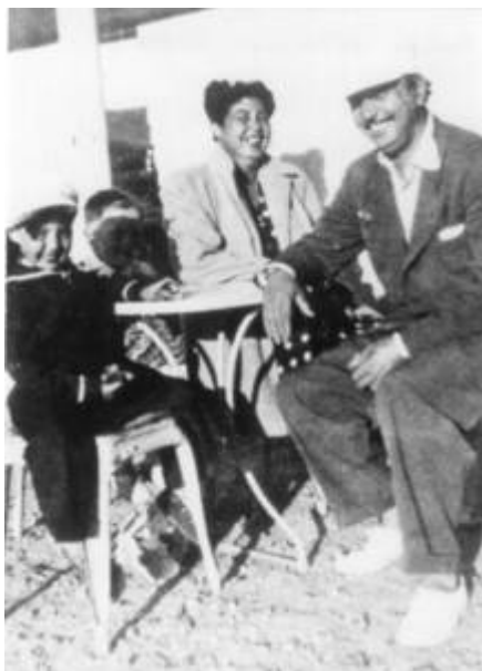
Cote CEMJazz: pve-docp-phot-5-11 (recto)