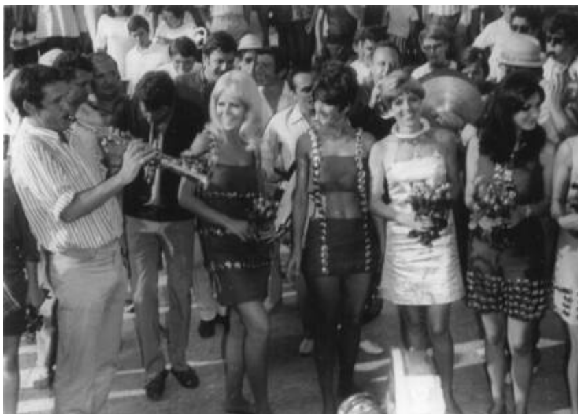
Cote CEMJazz: pve-docp-phot-5-16 (recto)