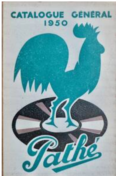
Cote CEMJazz: obr-pub-mus-7-3