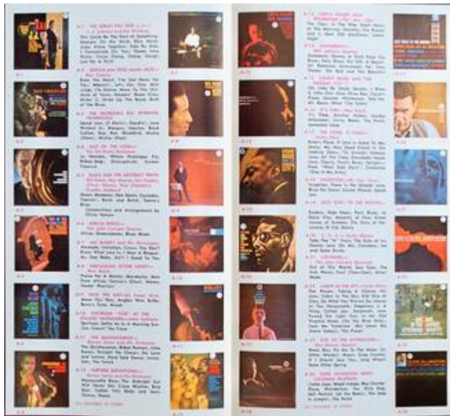
Cote CEMJazz: obr-pub-mus-7-5 (contenu)