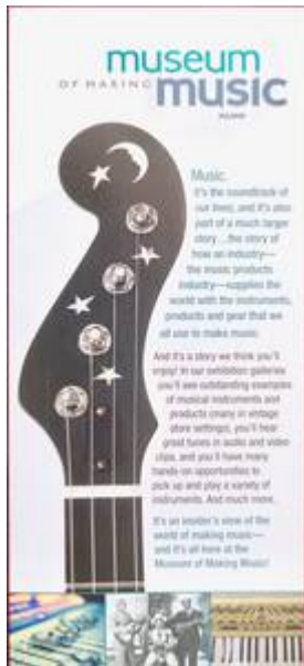
Cote CEMJazz: obr-pub-mus-7-6