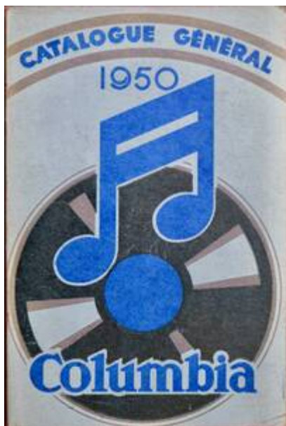
Cote CEMJazz: obr-pub-mus-7-2 (recto)