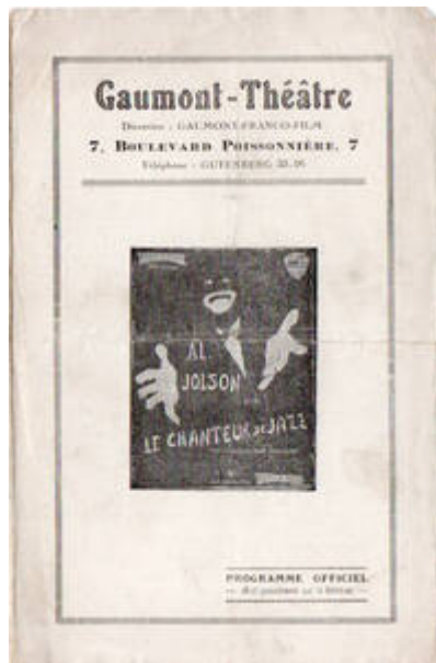
Cote CEMJazz: obr-pub-cine-1-1 (recto)