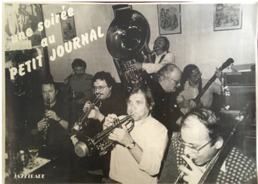
Cote CEMJazz: obr-affi-crt-1-3