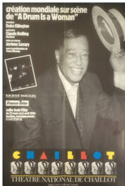
Cote CEMJazz: obr-affi-crt-1-2 (recto)