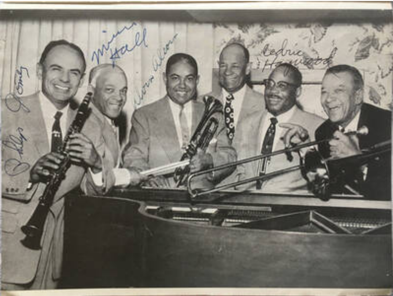
Cote CEMJazz: jpd-prog-crt-1-1 (contenu/a)