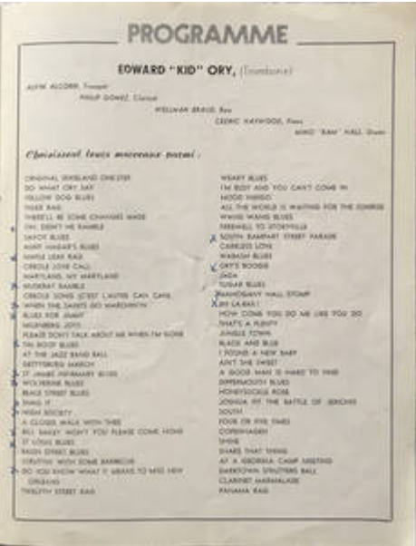
Cote CEMJazz: jpd-prog-crt-1-1