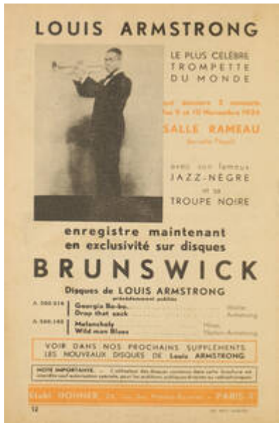
Cote CEMJazz: irk-pub-mus-1-6