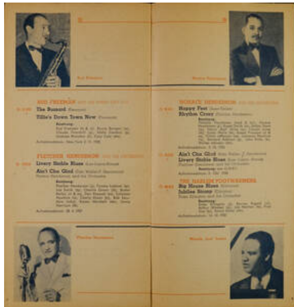
Cote CEMJazz: irk-pub-mus-1-10