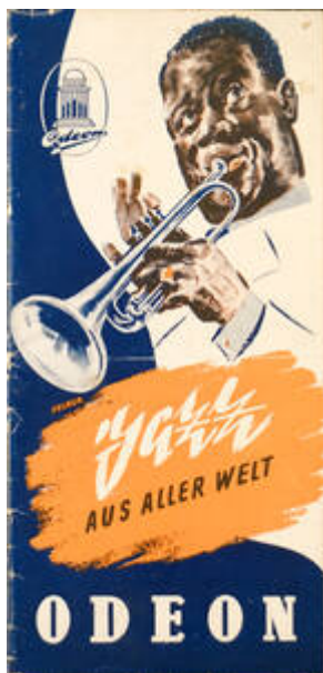
Cote CEMJazz: irk-pub-mus-1-10 (recto)