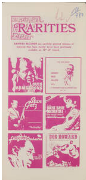
Cote CEMJazz: irk-pub-mus-1-18 (recto)