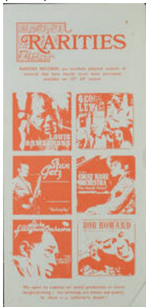
Cote CEMJazz: irk-pub-mus-1-17 (recto)