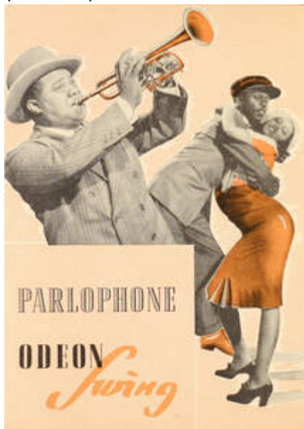
Cote CEMJazz: irk-pub-mus-1-11 (recto)