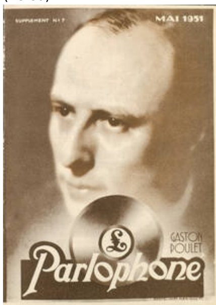
Cote CEMJazz: irk-pub-mus-1-2 (recto)