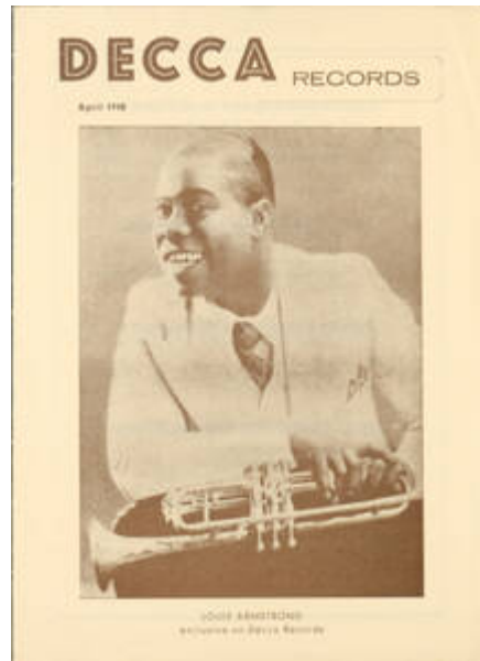
Cote CEMJazz: irk-pub-mus-1-3