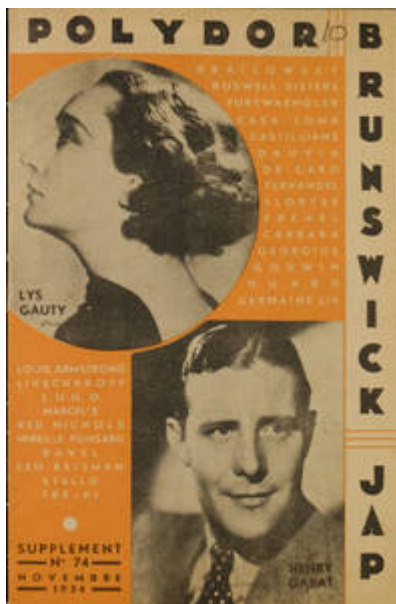
Cote CEMJazz: irk-pub-mus-1-6 (recto)