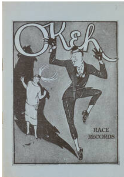
Cote CEMJazz: irk-pub-mus-1-19