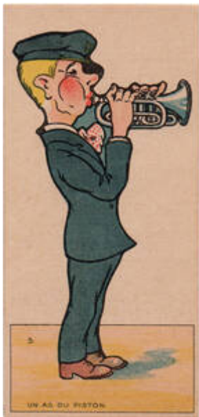
Cote CEMJazz: irk-pub-mus-1-1 (recto)