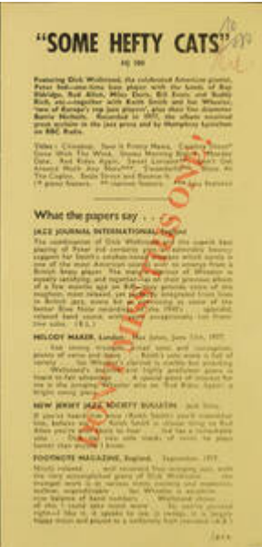
Cote CEMJazz: irk-pub-mus-1-14