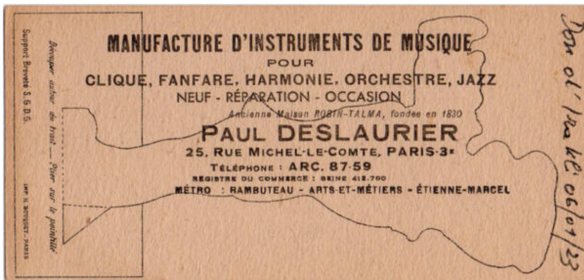
Cote CEMJazz: irk-pub-mus-1-1 (verso)