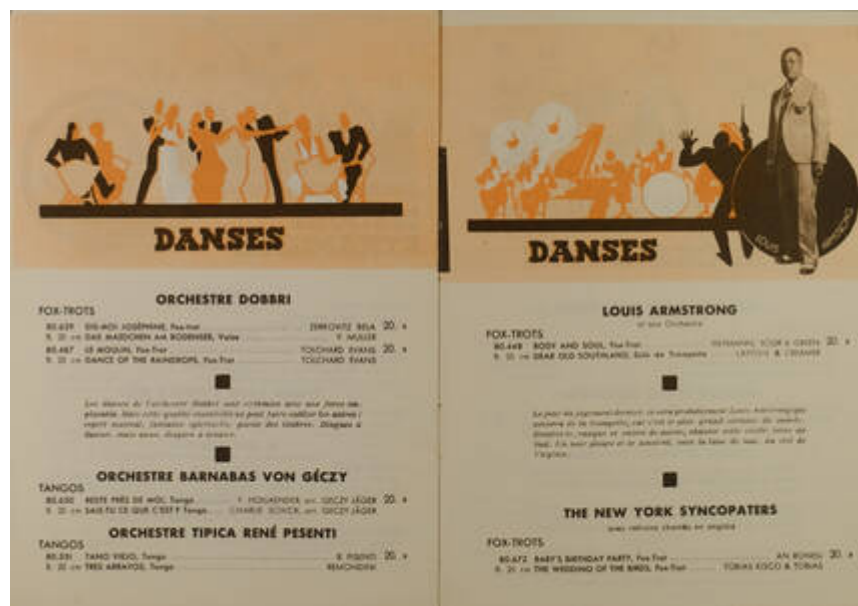
Cote CEMJazz: irk-pub-mus-1-2 (contenu)