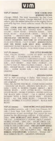
Cote CEMJazz: irk-pub-mus-1-13 (recto)