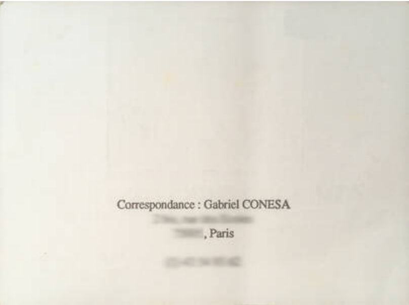
Cote CEMJazz: fsq-pub-mus-1-1 (verso)